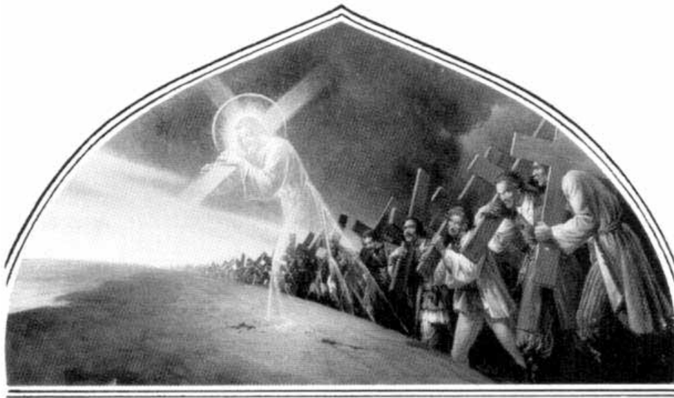
Maalaus Jerusalemin Litostrotonilla (kivipiha)

Riemut, murheet matkalleni viisaasti on jakanut. Vaikeinakin päivinä Herra oli lähellä, rakkauden voimin kantoi, murheeseenkin toivon antoi (VK 470:2). RL