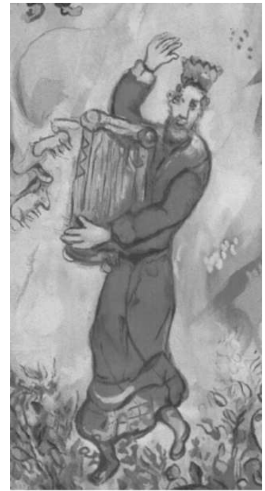
Kuningas Daavid soittaa ja laulaa

Vastaus jäi puhuttelemaan. Jumala todella kirkastaa itseään ja armoaan siellä, missä sitä vähiten odottaisi: saviastioissa, jotka omasta mielestä tai toisten mielestä eivät kelpaa enää mihinkään.